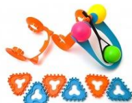
Dash roboti katapult